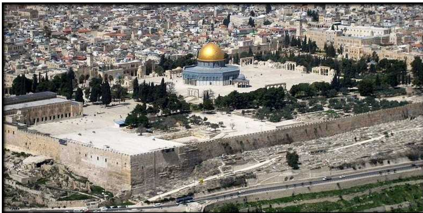
El Monte del Templo, Jerusalén. El principal lugar Santo para Israel